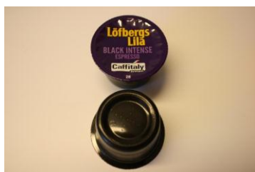
1. Kapsel för espresso.