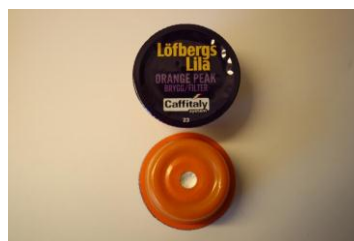
2. Kapsel för bryggkaffe/ Tea har märke i botten.